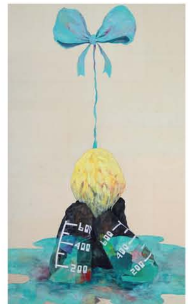
Hiroaki Iwahori "No flores"