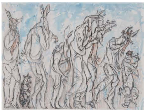
Shinzaburo Takeda "Tono"