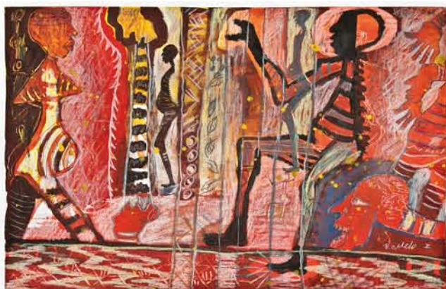
Baltazar Castellano Melo "Vómito"