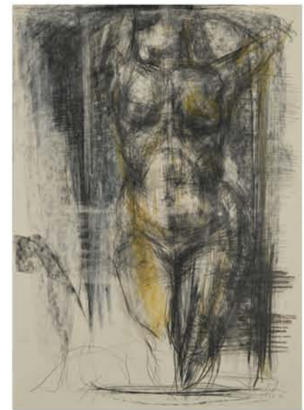
Aguri Uchida "Dibujo"