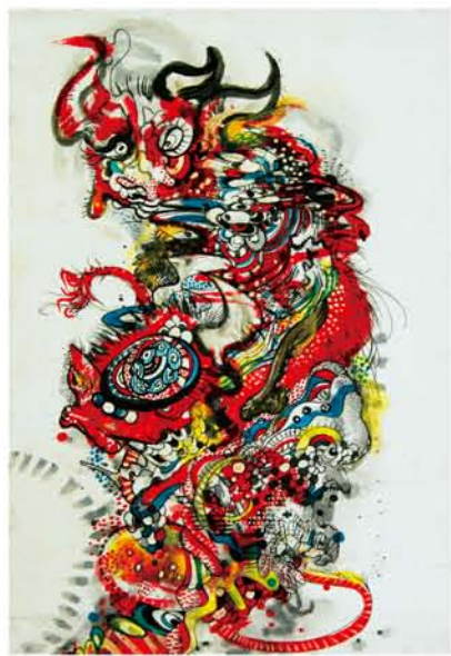
Honami Ohyama "Frente a Frente"