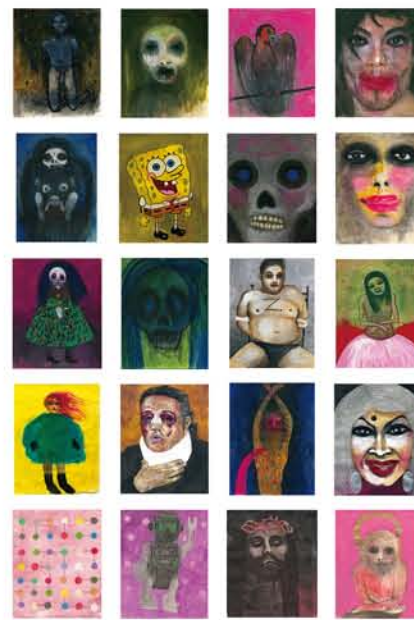
Alfonso Barrera Muñiz "Cuadro de honor" (fragmento)