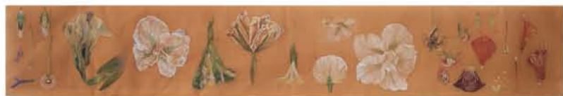
Misato Takagi "La flor 1"