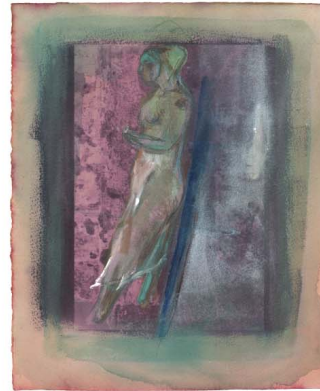
Aguri Uchida "Women"