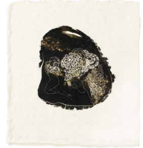
Diao Ying "The Night Eternal - Forever Spring"