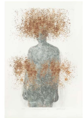
Ryuta Endo "sensus/rust-II"