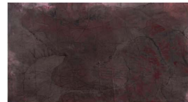
Shingo Tameso "Karenuma"