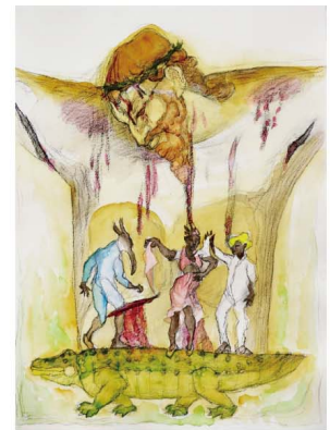
Shinzaburo Takeda "Baila los afrooaxaqueños"